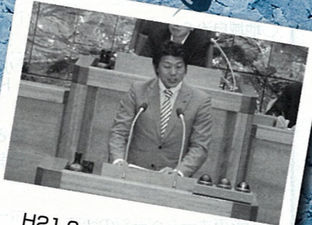
H21.6 鋭く的確な質問で前向きな回答 を引き出す