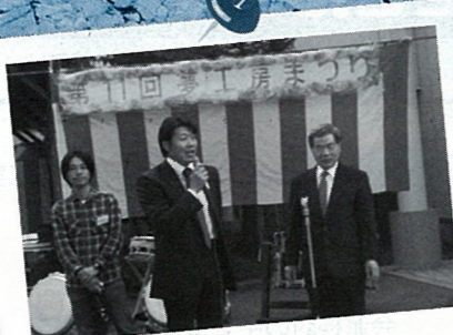
H22.10 福祉施設行事へ例年参加し、 現状と課題を伺う