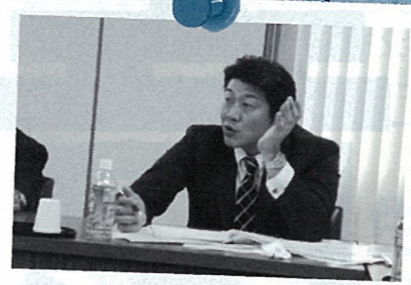
H20.5 産業文教委員会視察 岐阜市のまちづくり戦略を研修