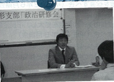
H21.5 政治研修会を開催