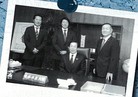
H22.10 鹿野農水大臣との意見交換