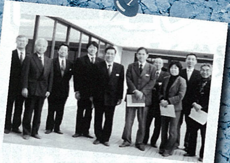
H19.12 第七小学校の委員会視察