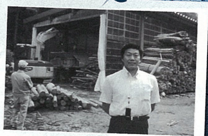
H20.7 森・林・産業活性化推進議連研修 (最上町・バイオ燃料)