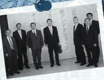
H20.4 山形県アンテナショップ視察