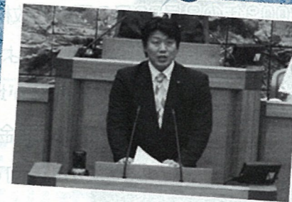
H22.6 通算5回目の一般質問