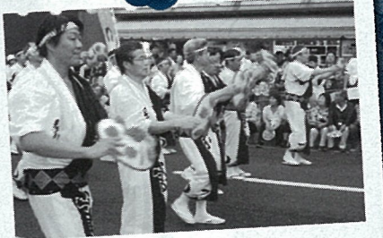
H22.8 例年参加している花笠まつり