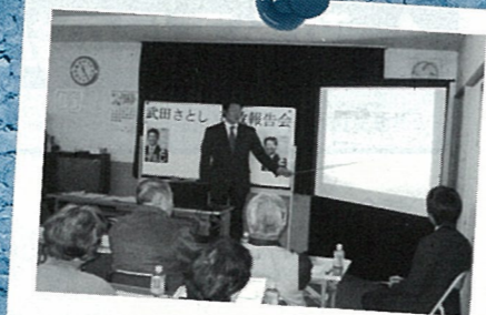
H22.11 例年開催される地元城西町での 市政報告会 (IT技術の活用で わかりやすく説明)