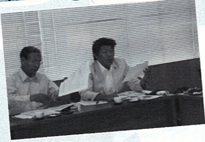
H20.7 大河ドラマと併せた観光誘客 戦略を研修 (長野市役所)