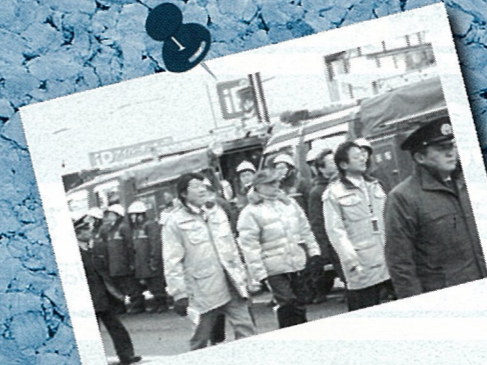
H23.1 山形市消防出初式