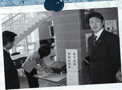
H20.1 市町村合併と複合施設の事例研修 (岡山県新見市)