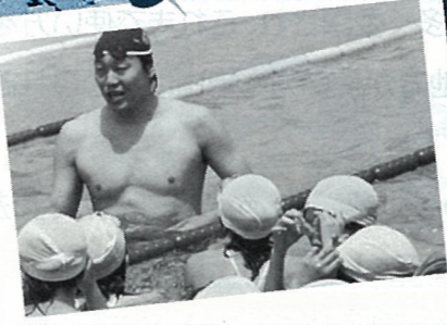
児童への水泳指導