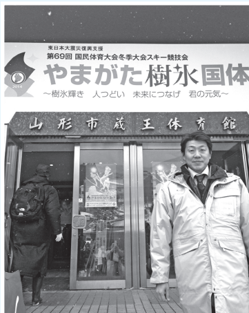
平成26年3月 やまがた樹氷国体開会式。多くのアスリート・観客が山形のメッカ蔵王に集いました。