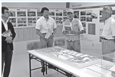
平成26年7月 会派視察にて宮城県牡鹿郡女川町の復興計画等の説明を受ける。