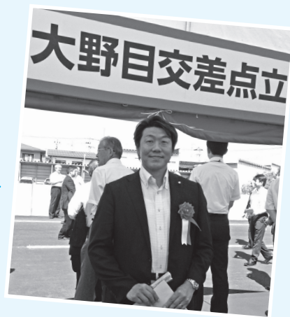
平成26年8月 大野目交差点立体化で通学路に迂回していた車が減少し、児童の安全性向上が期待されます。