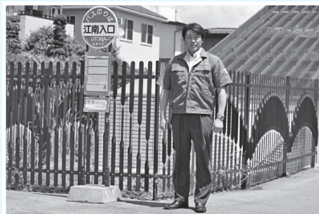
平成26年5月 地域要望等のあった箇所等の現地調査、当局へは進捗状況等について確認しながら施策の推進を求めています。