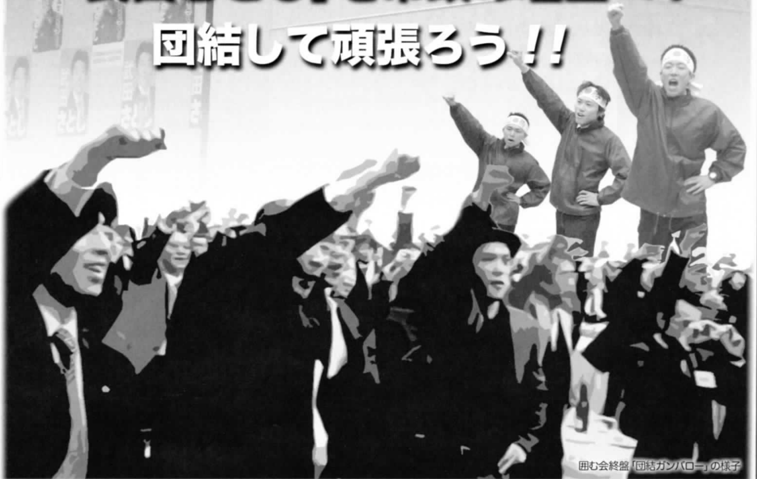
囲む会終盤「団結ガンバロー」の様子