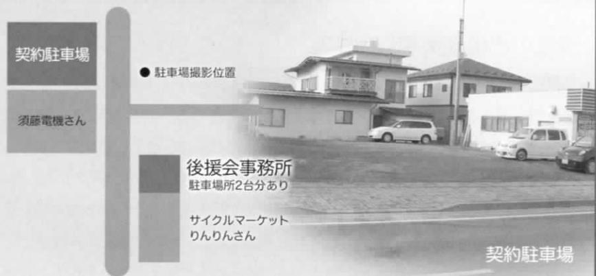
事務所付近 (拡大図)