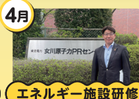
エネルギー施設研修