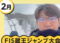
FIS蔵王ジャンプ大会