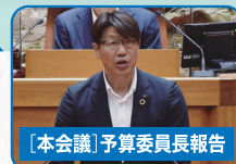
[本会議] 予算委員長報告