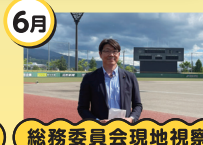
総務委員会現地視察