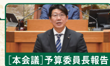
[本会議] 予算委員長報告