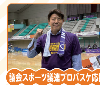
議会スポーツ推進プロバスケット