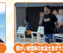
障がい者団体の水泳大会ボランティア