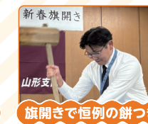
旗開きで恒例の餅つき