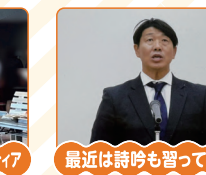
最近は詩吟も習っています